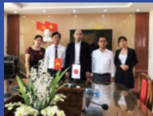
看護短期大学学長との面談

当社は7年にわたるインドネシア・ベトナムでの行政、国立大学、その他教育機関と日本への人材紹介で強固なコネクションを築いています。 当社は現地送り出し機関ではなく、現地の大学や職業訓練校と直接契約し、日本の企業に向けた専門性の高い教育を行っています。