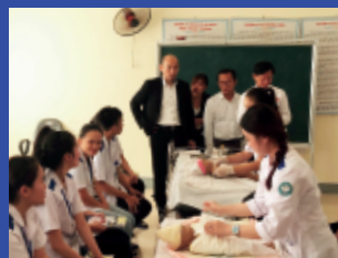
看護専門学校介護科の研修風景

就職後の出勤率に直結する出席率 99% と非常に高い専門学校や大学と提携し、企業と求職者とのマッチングを行います。 教育機関の学科コースには、介護や外食、宿泊の専門コースを特別に設置しています。